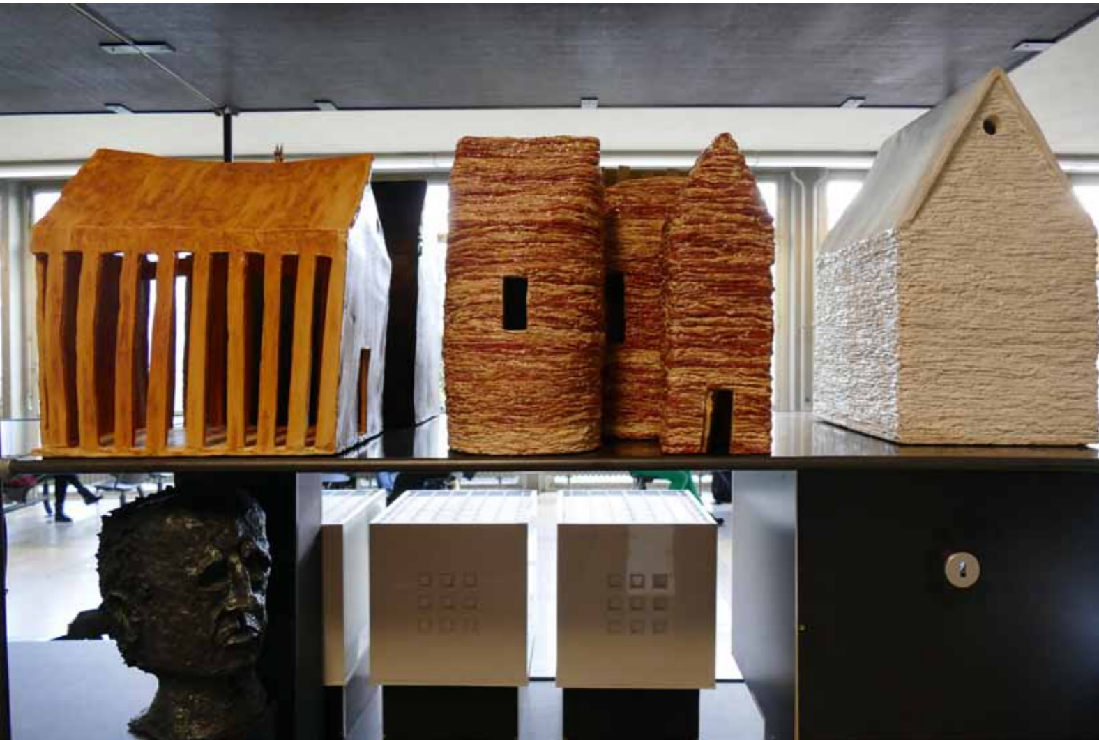
Arbeitsplatz: Fakultät 2014/15 (Detailansichten)

oben v.li: Ingrid Roscheck 2014 1. Scheune, 1. Anlage, 1. Kirche Keramik