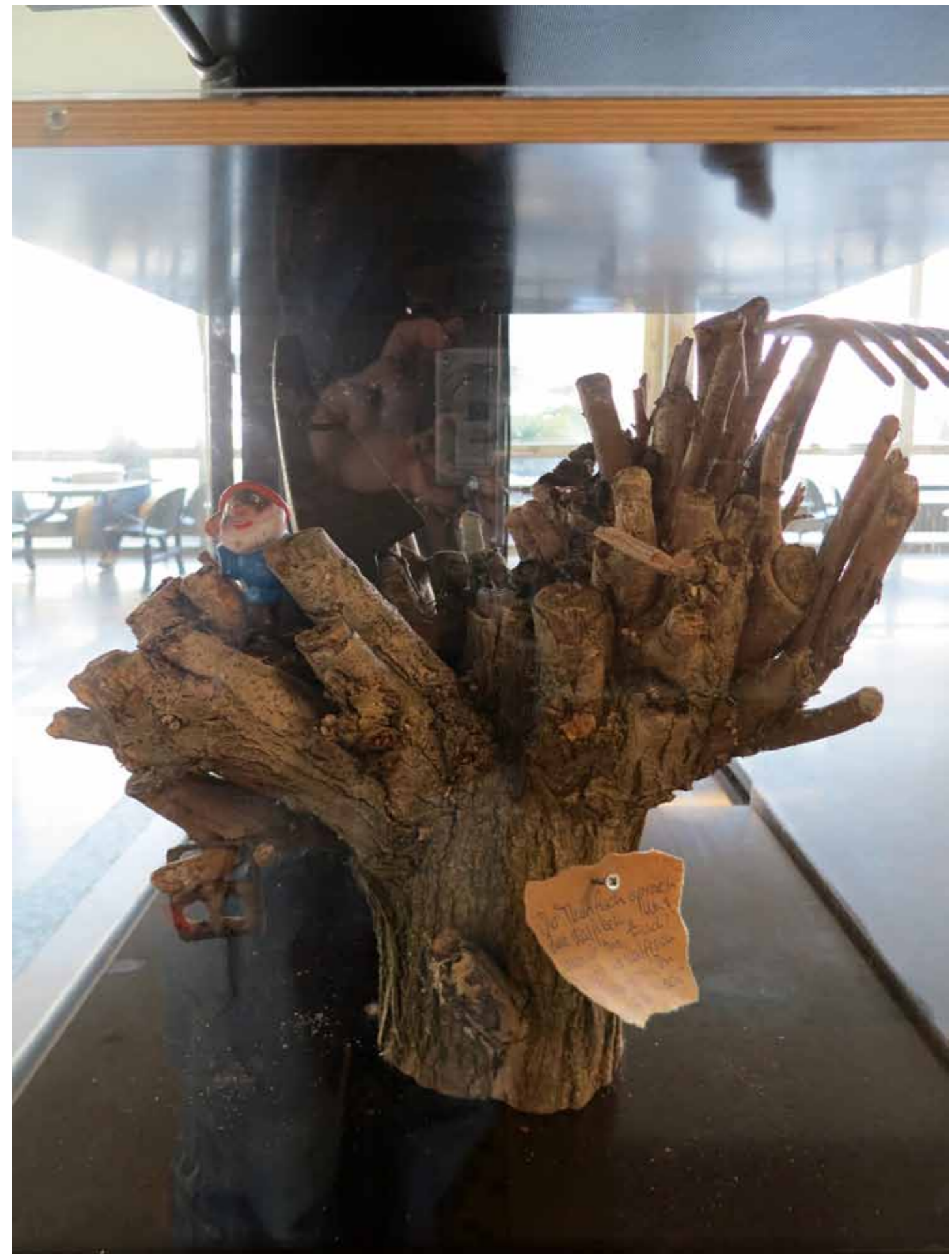
Isabelle Holtkamp 2014 Opas Garten Fundstücke, Papier/Text