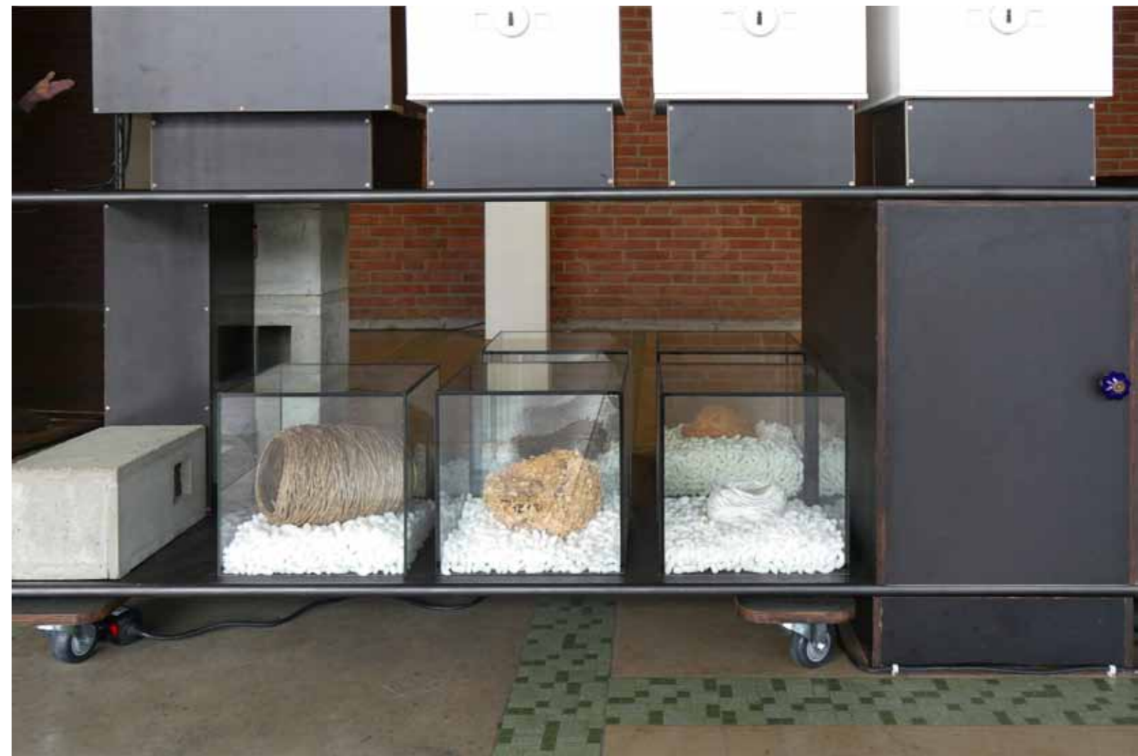
Arbeitsplatz: Fakultät 2014/15 (Detailansichten)